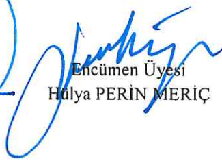
Encümen Üyesi Hülya PERİN MERİÇ