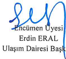
Encümen Üyesi Erdin ERAL